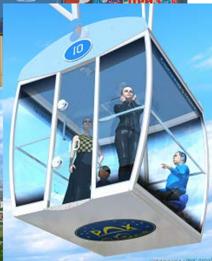
Кабина на 6 человек