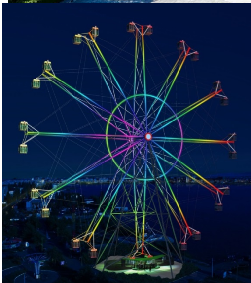
Ночной вид колеса обозрения