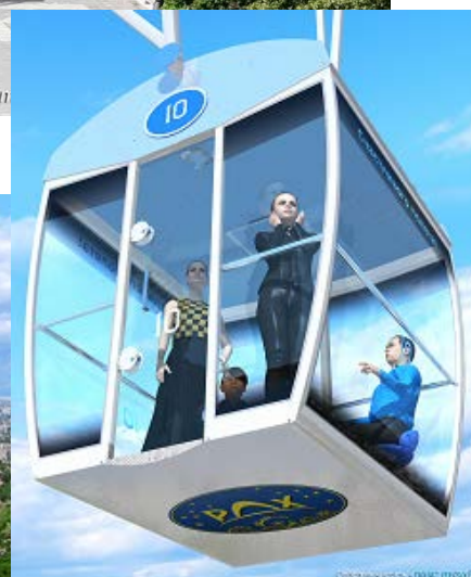
Кабина на 6 человек