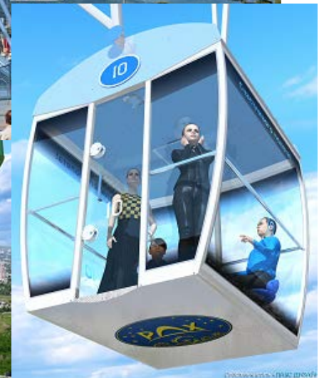
Посадочная платформа колеса обозрения